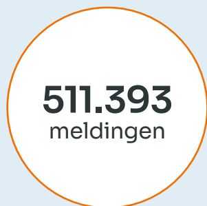
Aantal afgehandelde meldingen